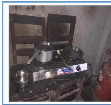
Les cuisines extérieures et intérieures